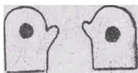
Рис. 1. Тренажер «Солнышко»

Для изготовления тренажера нужен материал темного цвета, из которого шьются две рукавички. Из желтой, красной или оранжевой материи вырезаются два кружка размером 4-5 см. Они нашиваются в центр ладонной поверхности рукавичек снаружи.